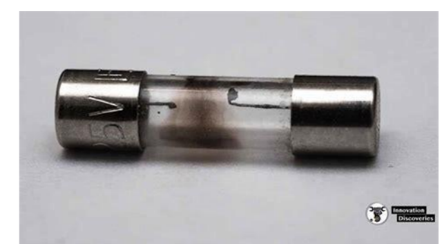
Ilustración 1. Fusible abierto