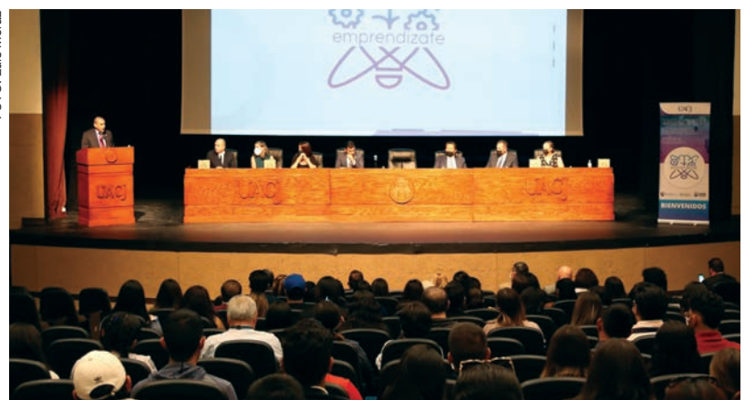
El evento de inauguración de la edición 2022.1 de Emprendízate.

del ICB; segundo lugar: Farmalévelle, por estudiantes del ICB y tercer lugar: Pocket Chef, por estudiantes del IIT.