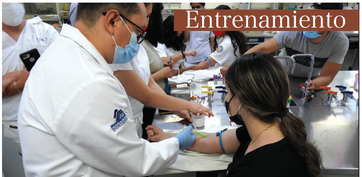
Nuevo Casas Grandes.- Alumnos del Programa de Nutrición de la División Multidisciplinaria de Nuevo Casas Grandes recibieron capacitación para la toma de nuestras sanguíneas.