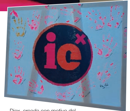
Diex, creada con motivo del la marca del evento conmemorativo del aniversario.

“La publicidad hoy en día se comprende y se reflexiona más como la planeación de una estrategia, que lleva a la persona, y no al consumidor, a vivir y a sentir una experiencia que puede impactar positivamente su vida personal y profesional”, agregó.