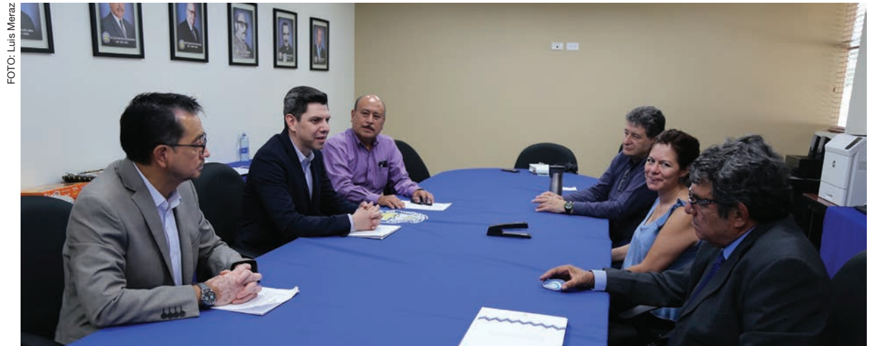
Representantes del CACEB, a la derecha en la foto, realizaron la evaluación de la licenciatura en mayo.