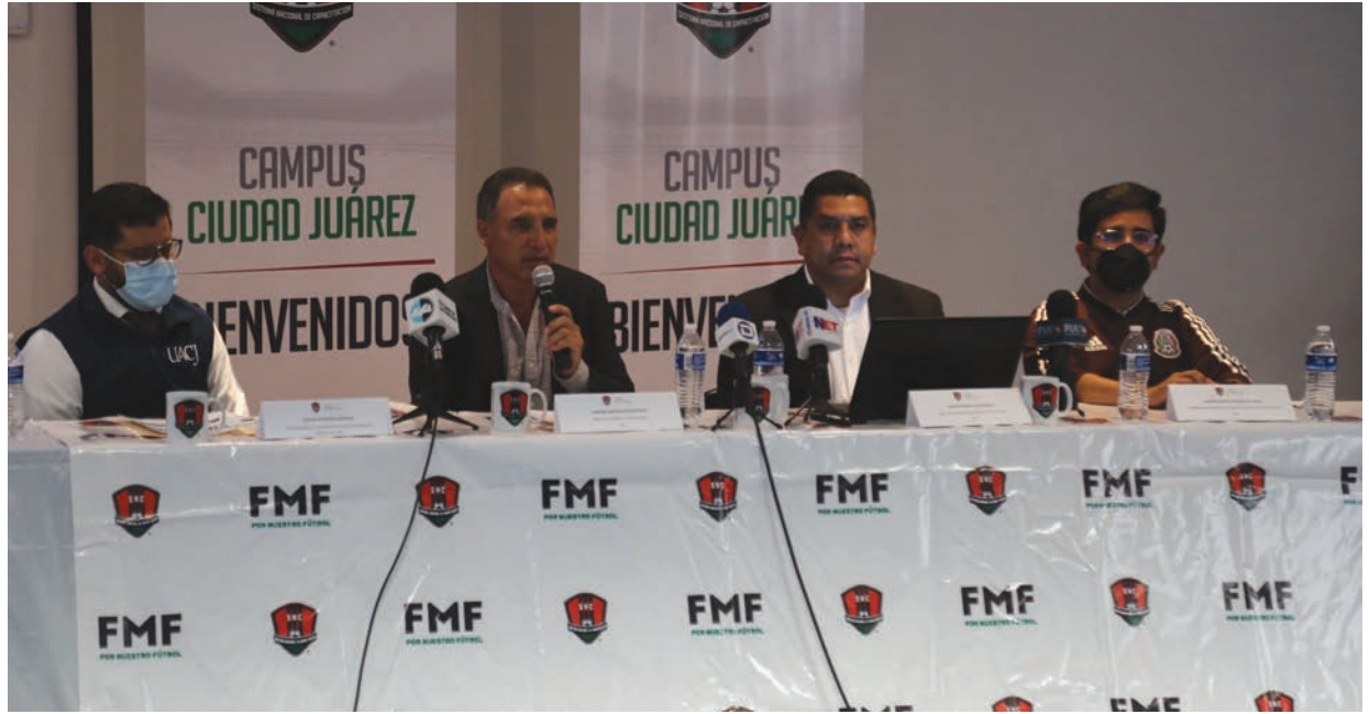
Representantes de la Federación Mexicana de Fútbol y de la Universidad en conferencia de prensa.

rá mejorar la calidad de los cursos que ofrece el Sistema Nacional de Capacitación, a fin de que pueda alcanzar los estándares que se tienen en Europa.