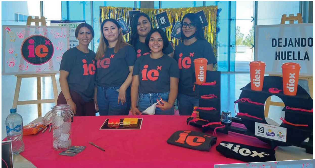
Estudiantes del programa durante la celebración del aniversario.

B de CU para invitar a la comunidad a ser parte de la festividad, además de poner en práctica sus conocimientos adquiridos en las aulas.