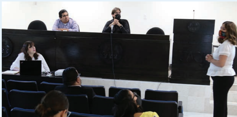
Alumnos de la Maestría en Investigación Jurídica presentaron sus proyectos de tesis.