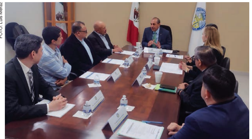
Reunión de autoridades universitarias con evaluadores del Conace.

Explicó a los evaluadores que la Universidad cuenta con un sistema departamental que le permite optimizar los recursos que tiene para la