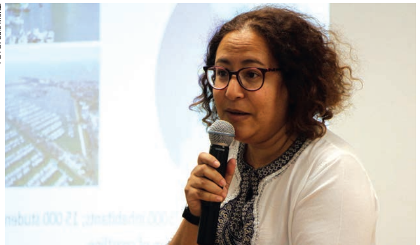
La conferencista es investigadora de La Rochelle Université.