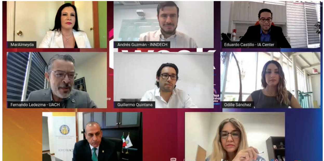
Representantes de las instituciones participantes en el programa estatal EBT.

Agregó que las instituciones de educación superior son los vínculos