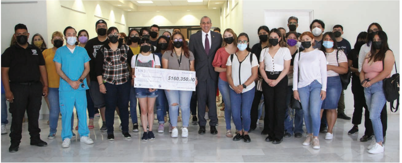
Estudiantes universitarios que recibieron las becas Compartir y Orfandad junto con el rector de la Universidad.