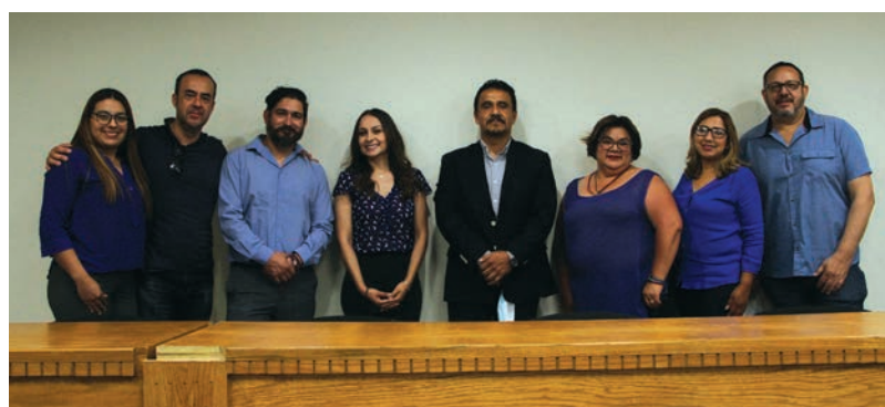
Integrantes de la mesa directiva del sindicato académico.