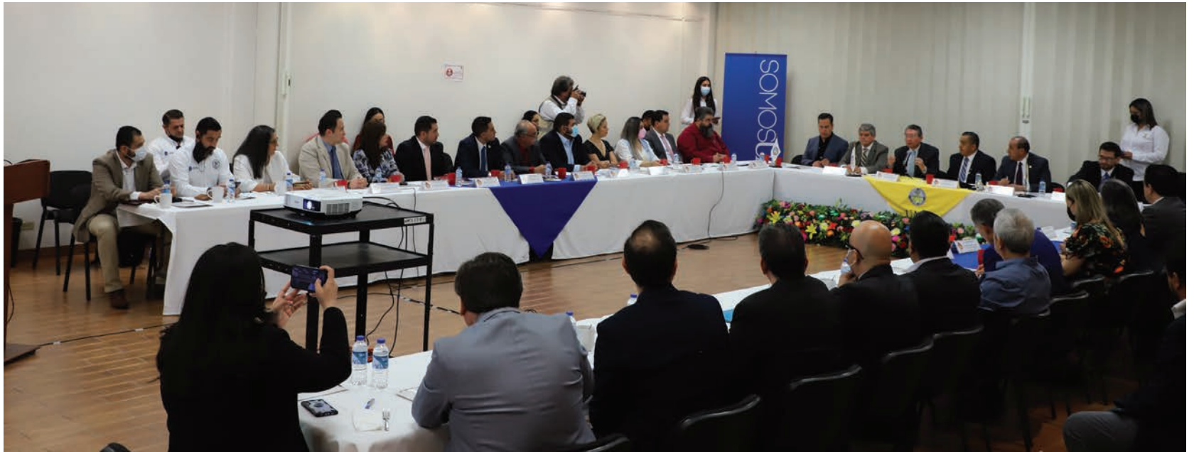
Los representantes de las instituciones miembros del consorcio celebraron la reunión de trabajo en las salas del Centro Cultural Universitario.