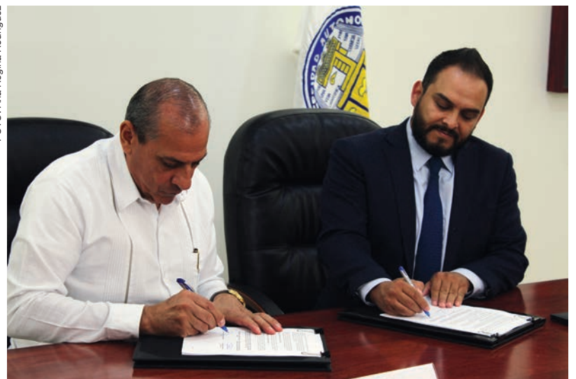
El rector de UACJ y el director de ICATECH presidieron reunión.