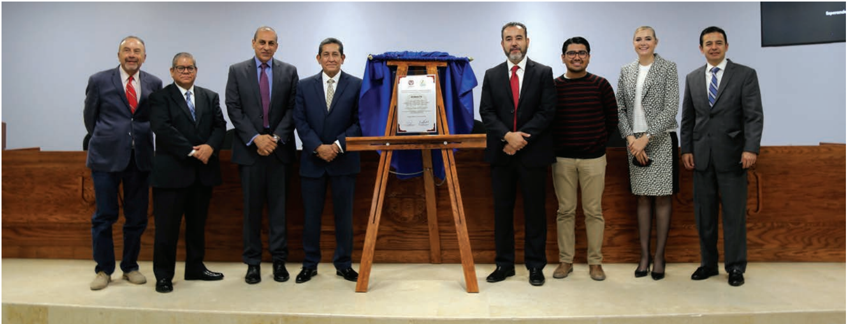
Autoridades universitarias en la ceremonia en la que se devolvió la placa por esta acreditación de la calidad del programa.