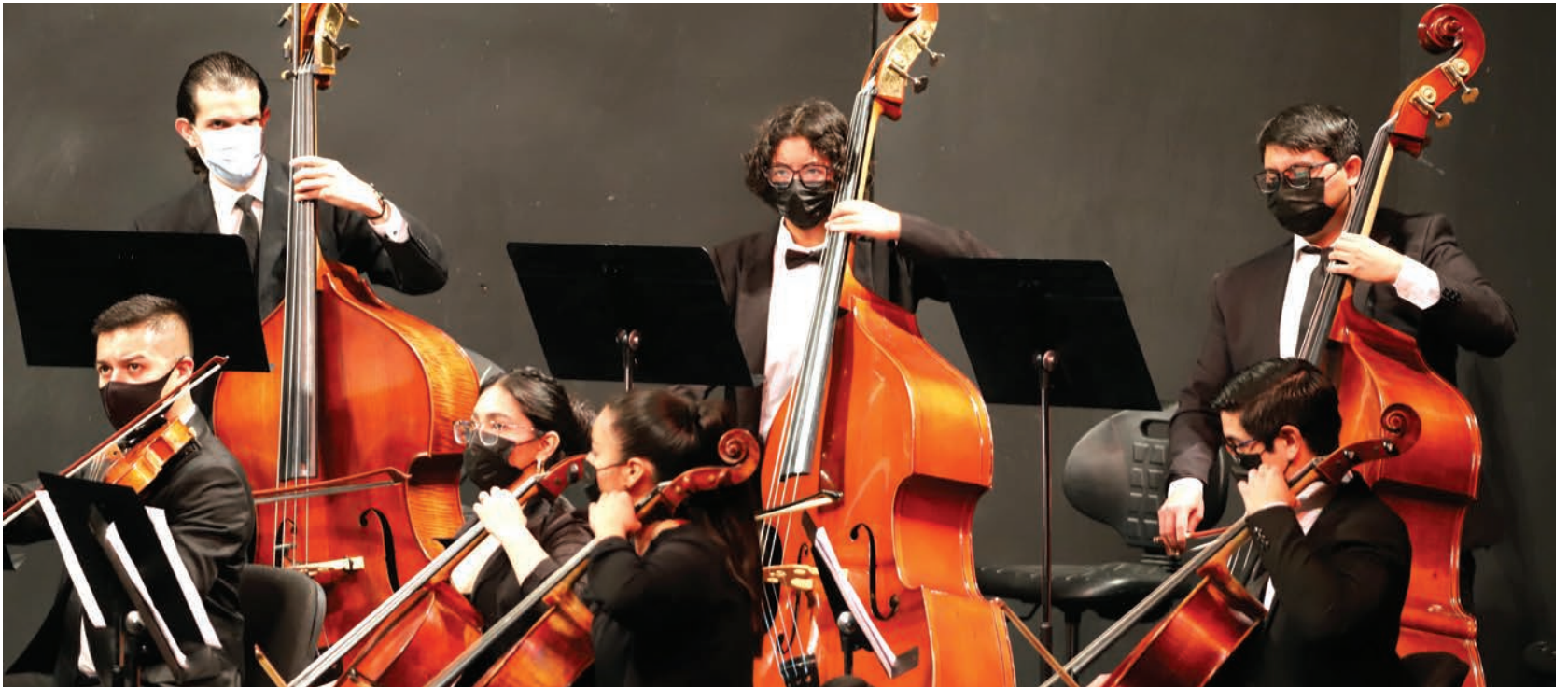
Integrantes de la OSJ durante el concierto ofrecido en el teatro Gracia Pasquel.