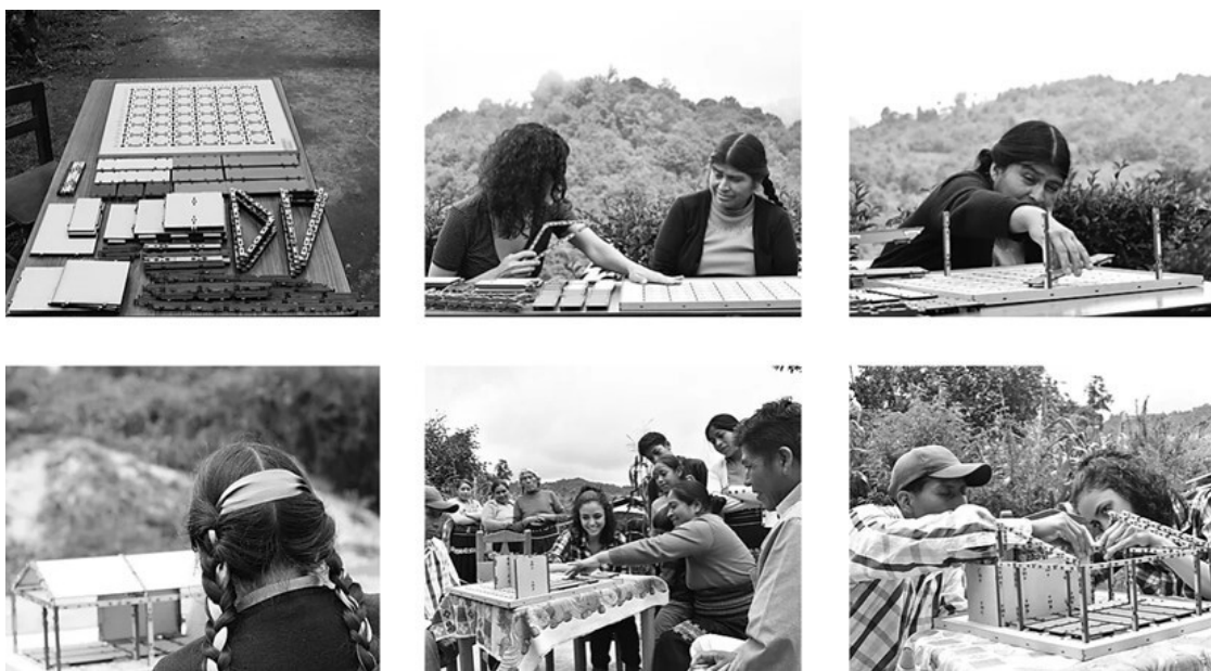
Comunal taller de arquitectura (fotógrafo no reconocido): Casas de parto, 2016-17. Recuperado de https://www.comunaltaller.com/casas-de-parto , el 17 de junio de 2020.

Figura 5. Actor abierto: si bien puede discutirse que los actores no poseen las herramientas de representación —y por lo tanto se continúa imponiendo un lenguaje especializado—, como en la figura 2, estas se encuentran aún en desarrollo, por lo que se puede argumentar que son las herramientas más avanzadas que se han logrado hasta el momento.