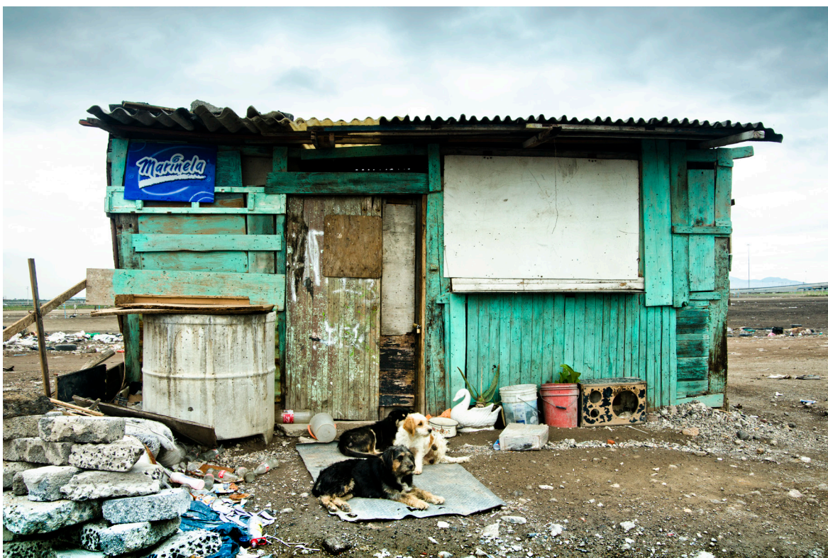
Figura 3. La otredad: actores y actantes. Betanzos, M.: #Bordos100, Arquitectura verde. Nezahualcóyotl, Estado de México, 2011.

Cortesía Marcos Betanzos, del archivo personal del autor. https://www.archdaily.mx/mx/02-301410/b-ordos-100-marcos-betanzos .