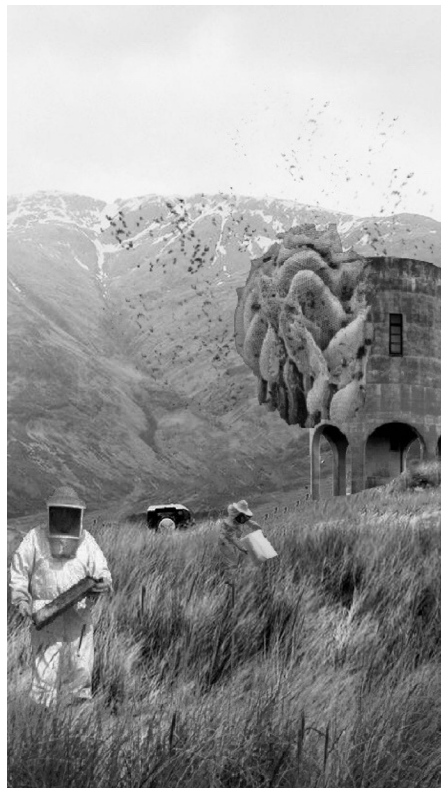
Figura 6. Hábitat abierto. Propuesta especulativa para una arquitectura posantropocéntrica/poshumana, una simbiosis del hábitat animal-humano. Sosa Tamayo, Diego: Panal, 2018. [Render realizado para la clase Teoría Superior de la Arquitectura, de la Universidad Veracruzana-Xalapa (Prof. Selim Castro)]

Sosa Tamayo, Diego: Panal, 2018. Render realizado para la clase Teoría Superior de la Arquitectura, de la Universidad Veracruzana-Xalapa (Prof. Selim Castro).