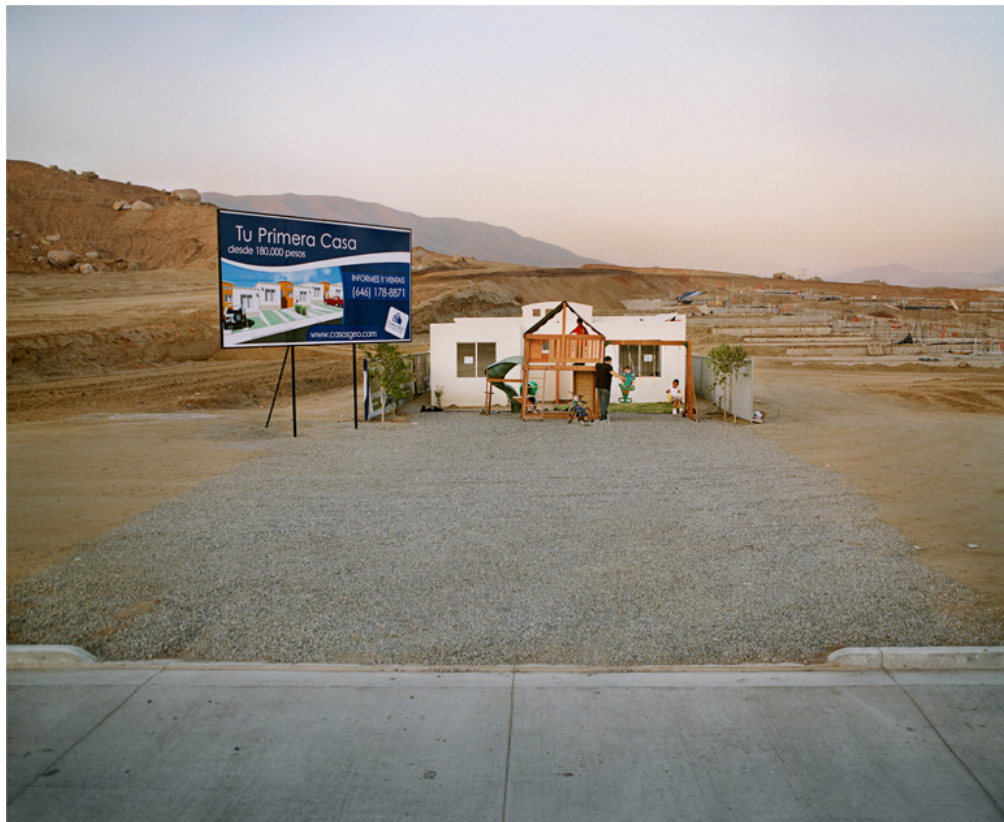
Figura 1. Falta de representatividad: un contenido colonizador. Corona, Livia. Two million homes for Mexico: Two Joint Houses as Model Home . Ensenada, México. 2000–present [original a color].