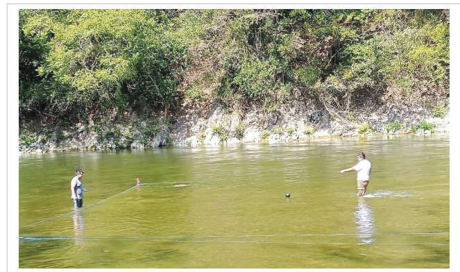
Figura 4. Mediciones de campo en la comunidad de Taman.

Los resultados obtenidos para esta comunidad son los mostrados en la Tabla 5 .