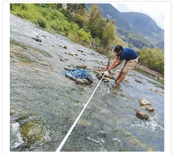
Figura 2. Medición de profundidad y ancho del río.

Para la medición de profundidad y ancho del río se utilizó una cinta métrica donde se obtuvieron distintos valores (Figura 2) y, posteriormente, se aplicó un análisis estadístico básico para el cálculo de valores medios y la desviación estándar.