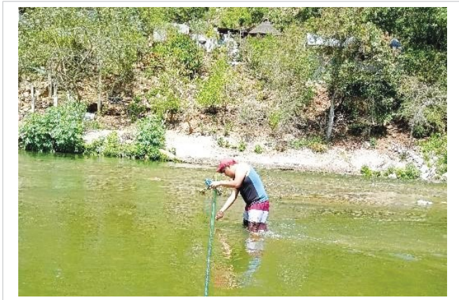
Figura 3. Mediciones de campo en la comunidad de Vega Larga.

Un ejemplo de la zona de medición se observa en la Figura 3.