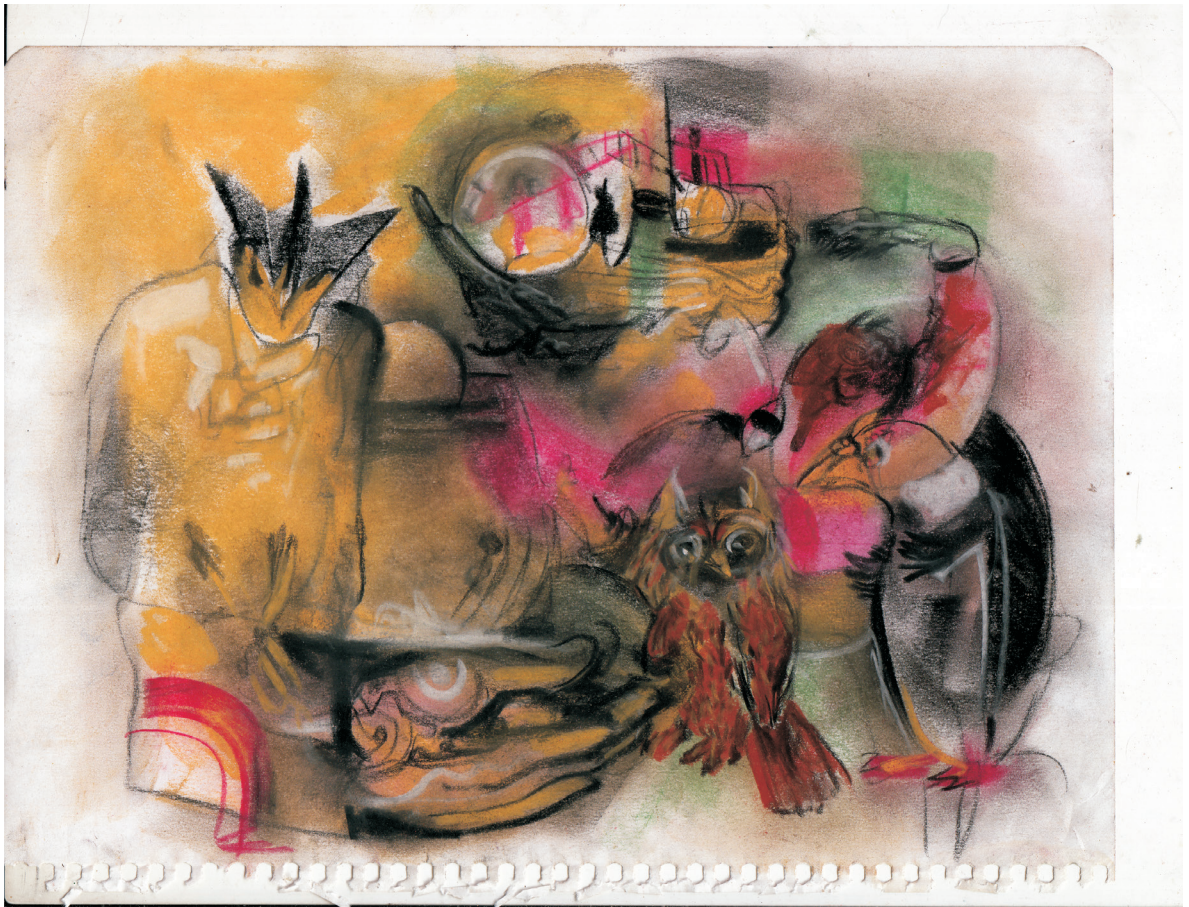
Mario Ortiz , Mis naufragios , 2018.