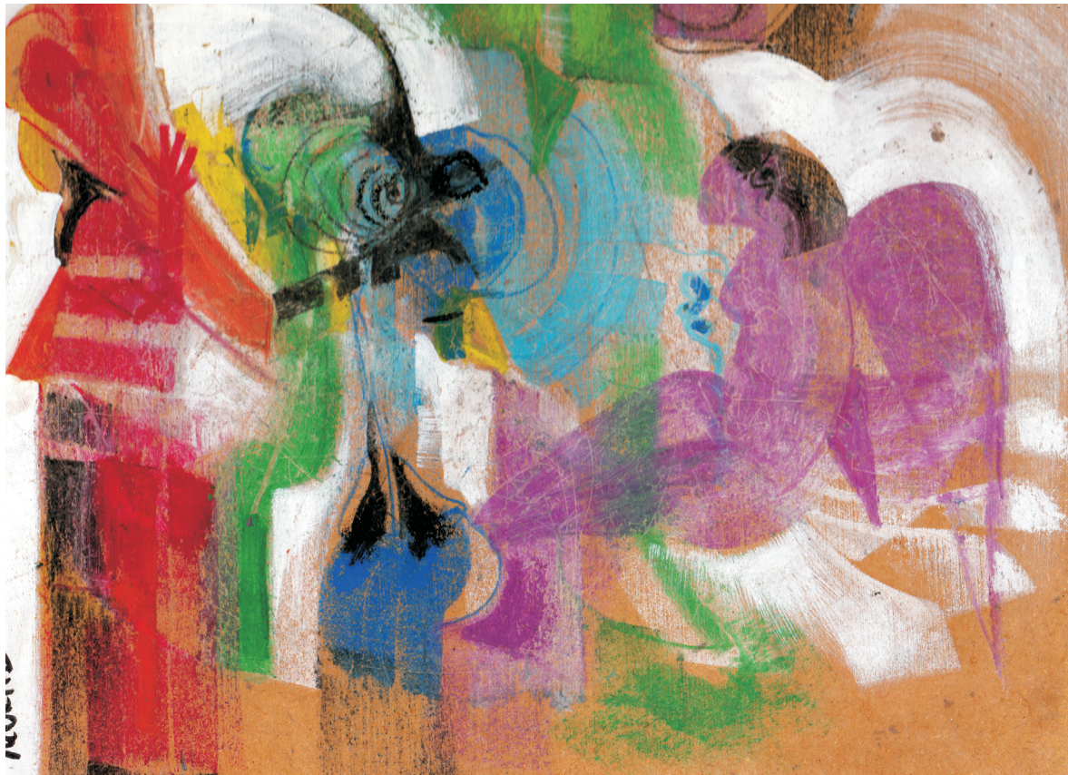
Mario Ortiz , El ángel de alas rosas , 2012.

Tomo cualquier momento, cualquier papel, cualquier tabla, impregno todo de color desordenadamente con manos mojadas, espátulas, esponjas, trapos, hasta a veces utilizo pinceles. Créanme, las figuras emergen solas. Esa es mi técnica, señoras y señores. Lo revelo ahora. No les extrañe que ande a veces con mi cartapacio obsequiando obras o vendiéndolas por kilo, como maliciosamente difundía un camarada. Nada me han costado. Soy un artista silvestre, me debo a todos lo que me quieren. Por eso los amo yo también.