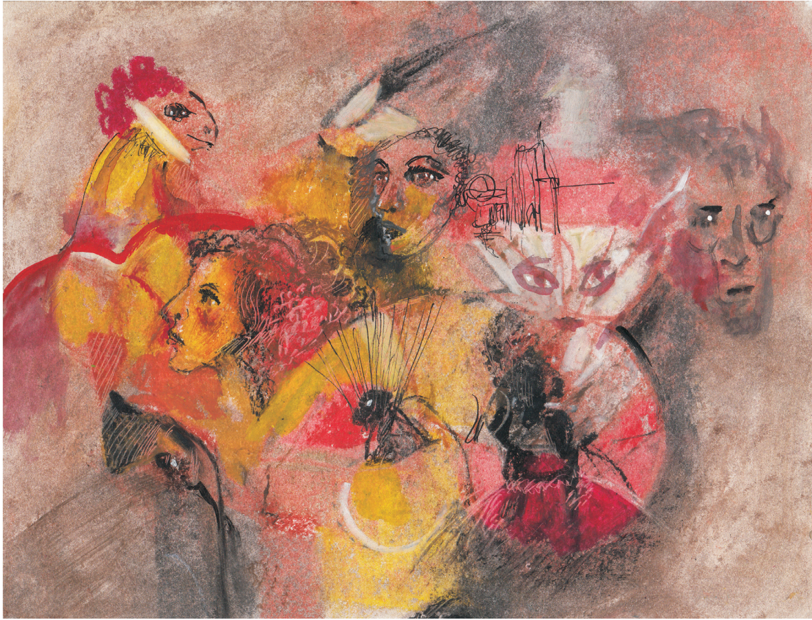
Mario Ortiz , Leonora , 2006.