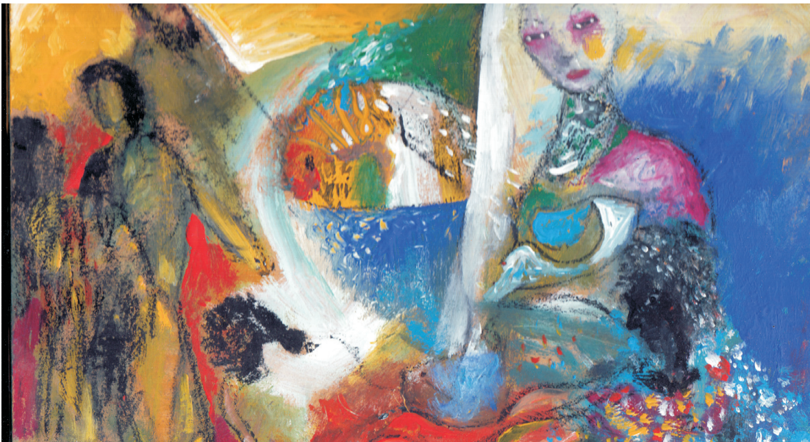
Mario Ortiz , Levitación , 2001 (detalle).