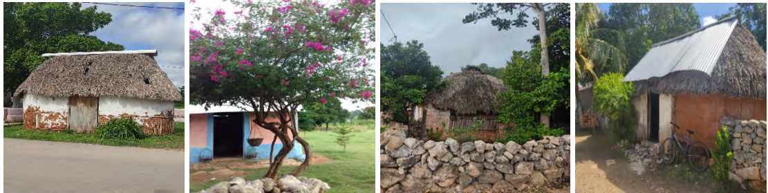
Casas mayas de las comunidades de Nunikiní, Uzhasil-Edná, Kanki, y Tankuche

Sin asumir una postura de resistencia a la modernidad en la construcción de las casas, se aprecia que aún hay mucho por descubrir y aprender de los mayas en cuanto a su casa. Sin duda no era, ni es únicamente un espacio físico para vivir, es también un espacio de recreación de interrelaciones personales, familiares e incluso comunitaria; de interacción no sólo entre personas, sino también entre plantas, animales y su cosmovisión.