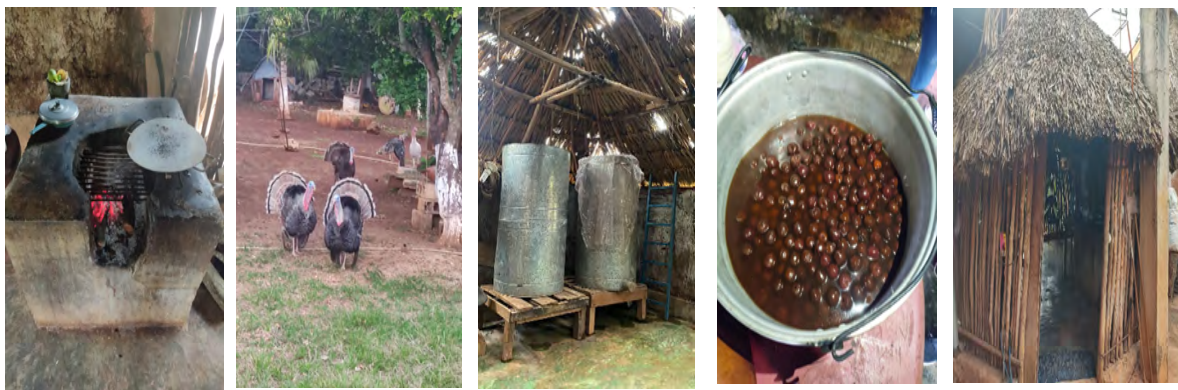
Espacios, objetos y alimentos de las casas mayas: cocina, fogón, solar, silos de maíz y dulce de nance; Kanki y Tenabo