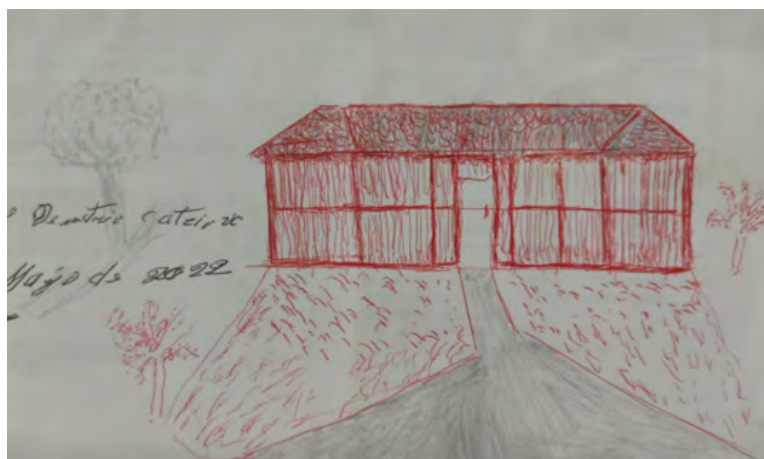
Representación de la casa maya del entrevistado (dibujo del entrevistado, 2022)