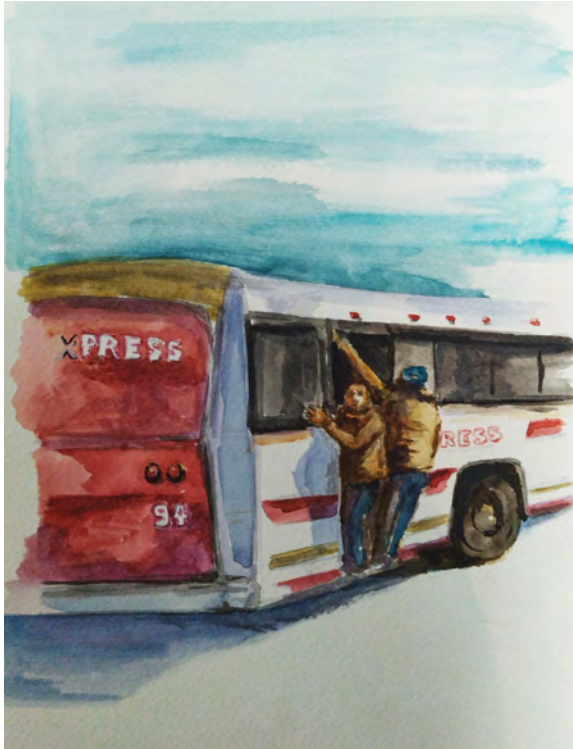
Luis Rocho Aguilera. "Talamás", 2022.