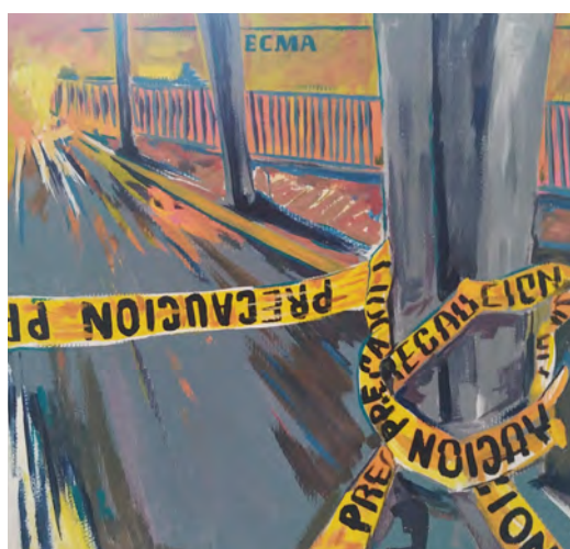
Luis Rocho Aguilera. "Sin título", 2022.