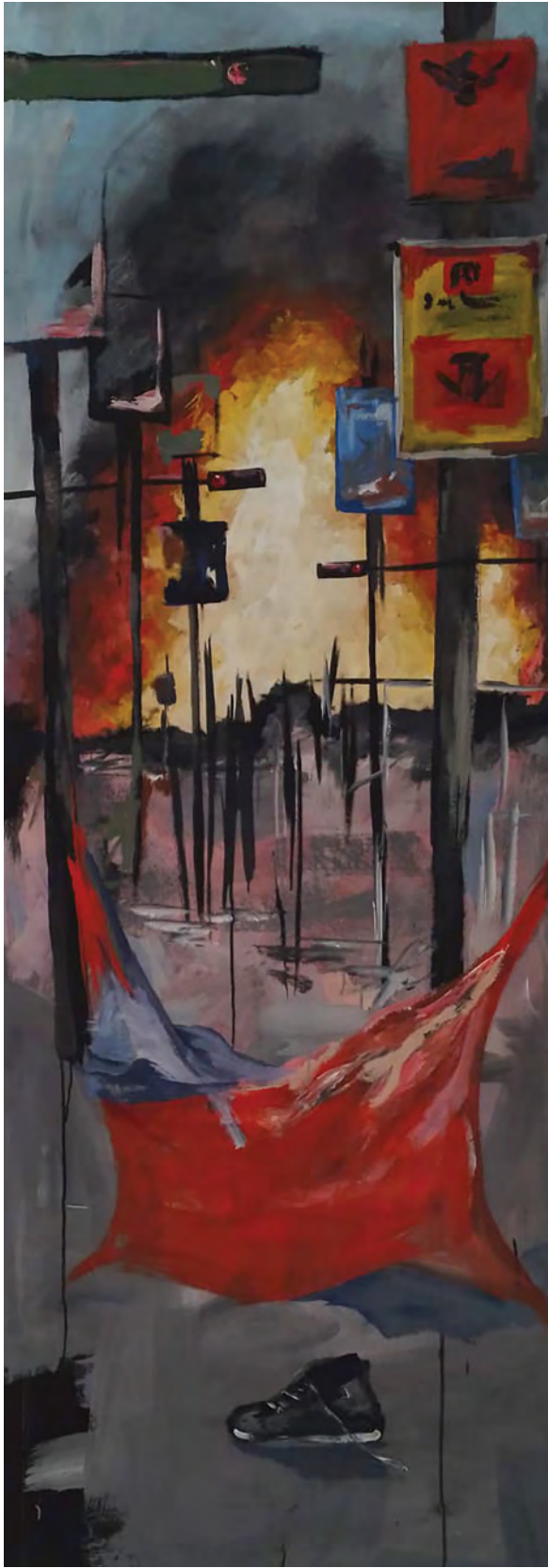
Luis Rocho Aguilera. "Sin título", 2022.