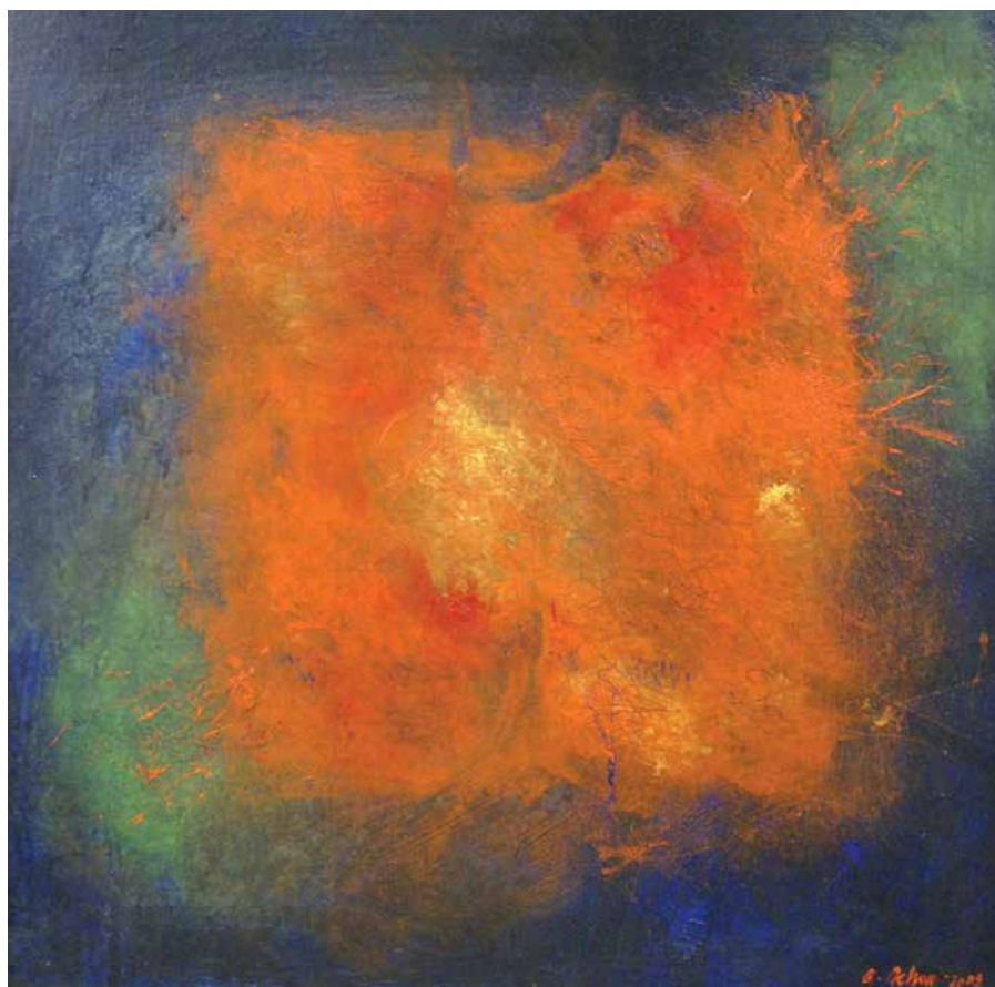
Antonio Ochoa. Sin título