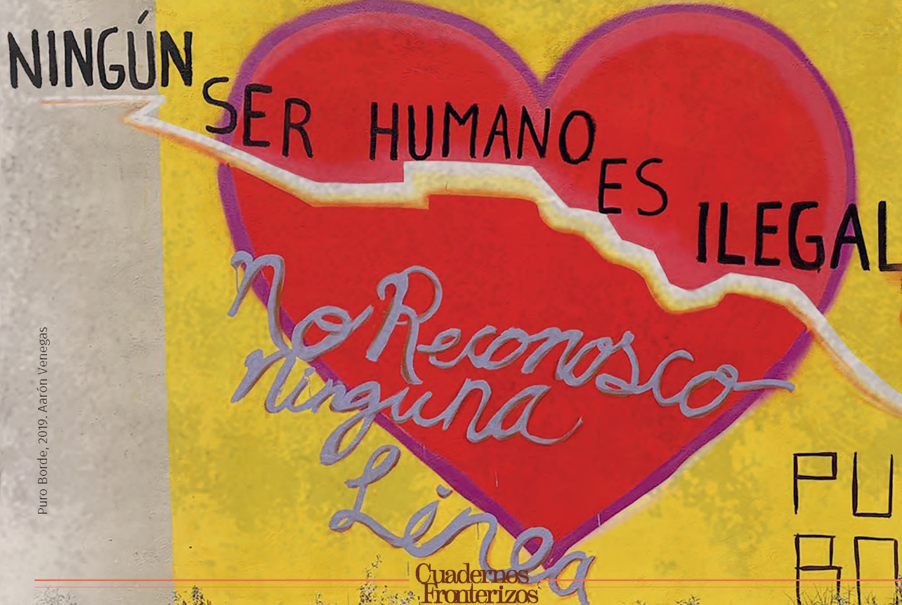
Puro Bórdé, 2019. Aarón Venegas