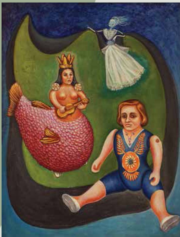
Retrato Concha Michel, Aurora Reyes