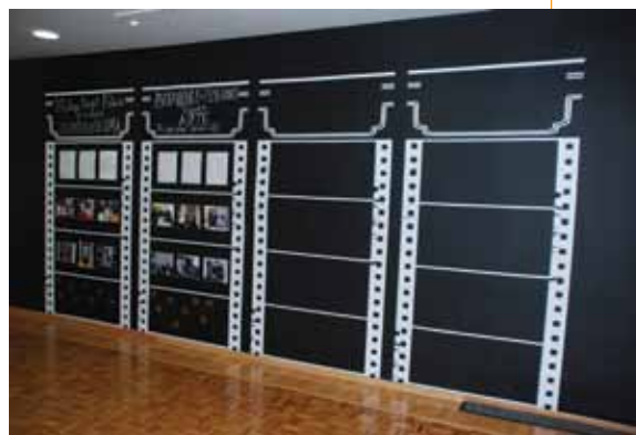
Espacios Comunes.

En general, la acción en el campo cultural representa una potente herramienta para la transformación social y para abatir los problemas. Los trabajos que componen la exposición Espacios Comunes, la cual podrá ser apreciada en el Museo de Arte de Ciudad Juárez hasta febrero de 2014, da cuenta de los esfuerzos de diversos colectivos que realizan trabajo en Ciudad Juárez. Esta acción cultural promueve la participación ciudadana en la vida cultural y permite demandar políticas culturales inclusivas