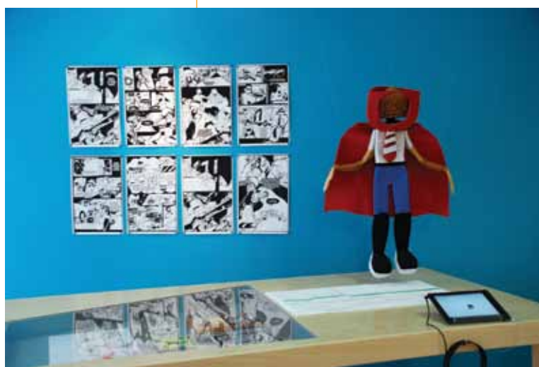
Espacios Comunes.