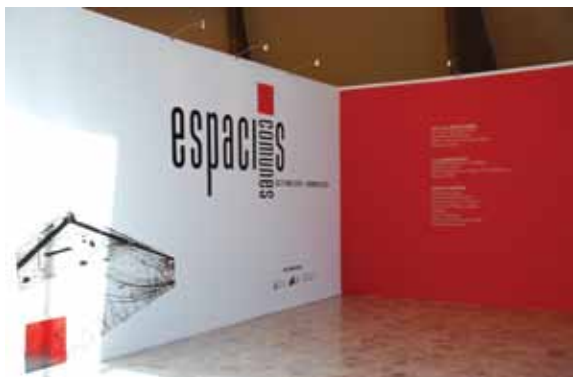
Espacios Comunes.

acontecer de una ciudad. Por su metodología constituye un instrumento pedagógico, participativo, contextual y narrativo, que pone en diálogo a los colectivos, artistas y promotores culturales entre sí, y a estos con el público.