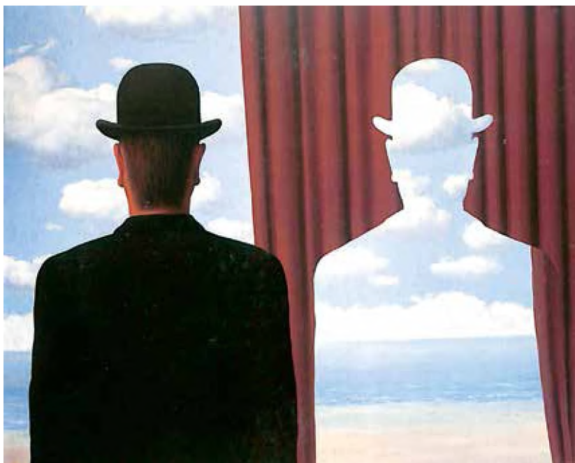
Calcomanía , 1966, René Magritte

Los "trucos" de Magritte (representaciones dentro de representaciones, duplicaciones, formas incompletas, etcétera) han sido explotados hasta el cansancio por toda clase de artistas con fortuna desigual, sin que hayan deslavado en lo más mínimo la originalidad y el misterio que se muestra por medio de esos objetos que ahora no podemos disociar de él como autor: manzanas, castillos en el aire, palomas-cielo, espejos que no reflejan, rostros ocultos, huevos enjaulados, pájaros-hoja, rosas gigantes, cortinas, puertas, rostros de cuerpos femeninos, sirenas invertidas, el fuego, y, por supuesto, los hombres de bombín y paraguas, que reproducidos a placer, pueblan su mundo y el nuestro.