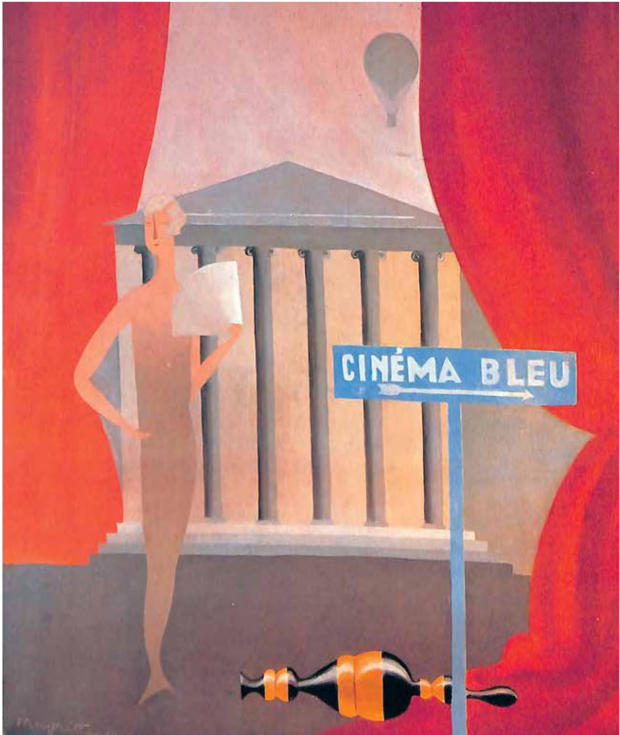
El cine azul, 1925, René Magritte