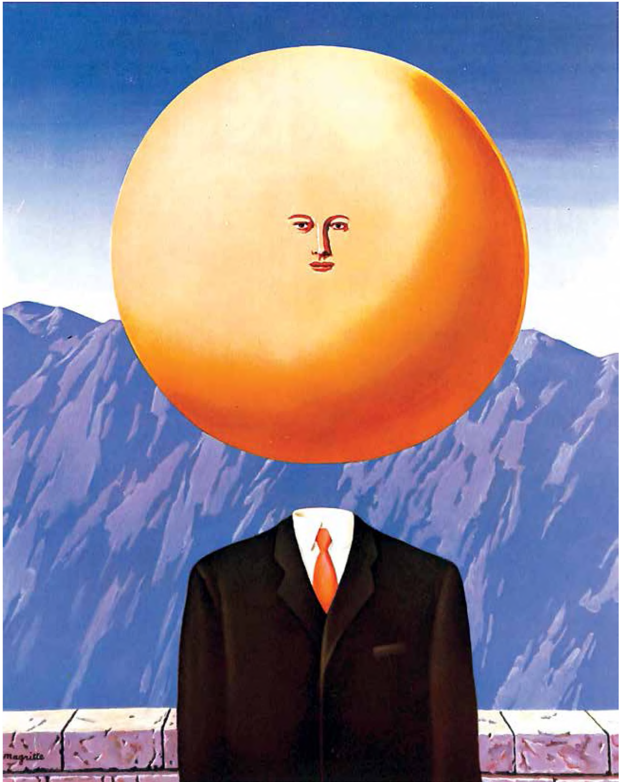
El arte de vivir , 1967, René Magritte