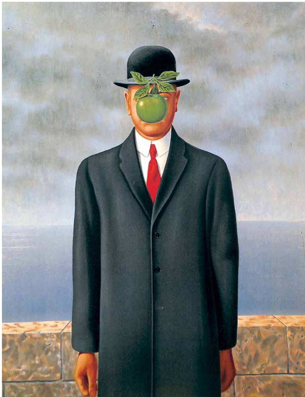
El hijo del hombre, 1964, René Magritte

Magritte Magritte Magritte Magritte Magritte Magritte